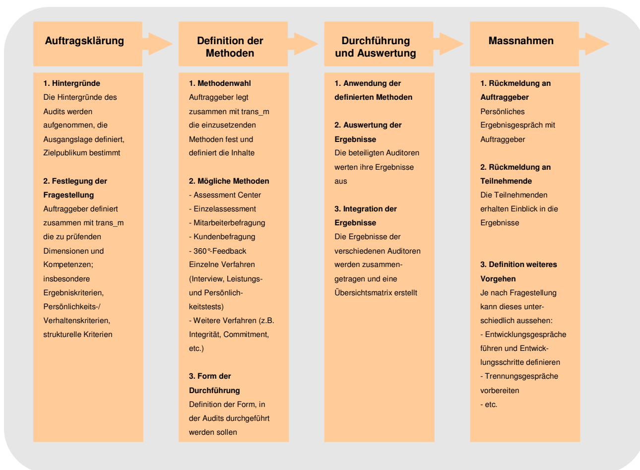
Abbildung 2: Der Management Audit Prozess

Der Prozess des Management Audits ist klar definiert. Gleichzeitig richtet sich der Inhalt, also die Wahl der Methoden, nach der jeweiligen Fragestellung. Die nachfolgende Grafik zeigt den Ablauf eines Audits im Überblick: