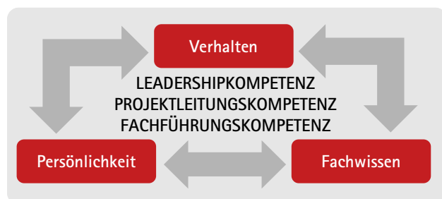
Abbildung 1: Zusammenhang zwischen Fachwissen, Persönlichkeit und Verhalten

Fairness und Objektivität der Auswahl von Teilnehmenden: Personen können sich dann optimal entfalten, wenn sie das tun können, was ihren Interessen, Neigungen und Fähigkeiten am ehesten entspricht. Daher werden die Teilnehmenden für das Programm sorgfältig und professionell